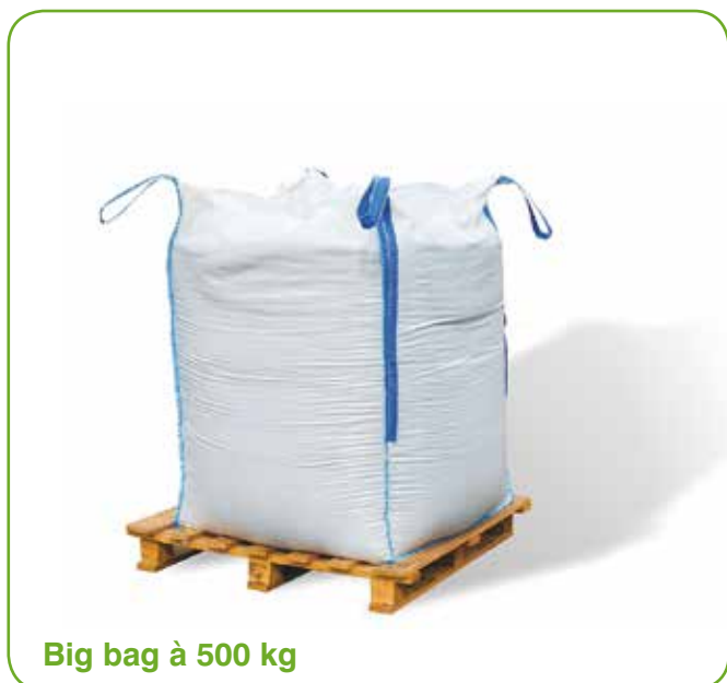
Big bag à 500 kg