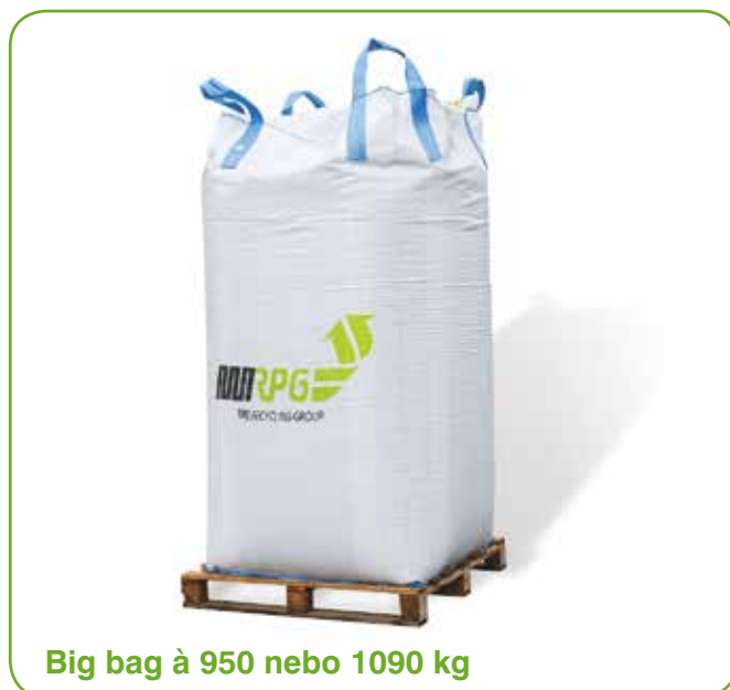
Big bag à 950 nebo 1090 kg